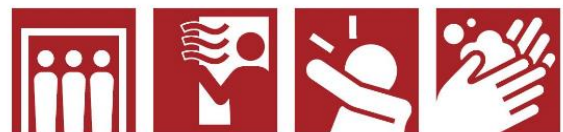
密室回避 換気 咳エチケット 手洗い