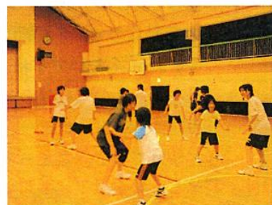
ミニバスケットボールの練習風景