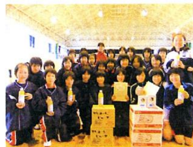
優勝した愛南チーム