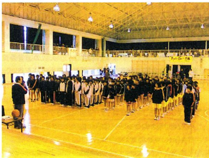
南宇和スポーツクラブ主催のミニバスケットボール大会