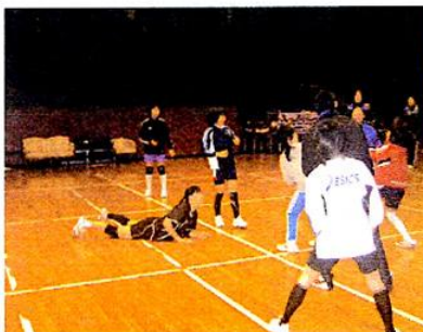
大人だって負けてられません